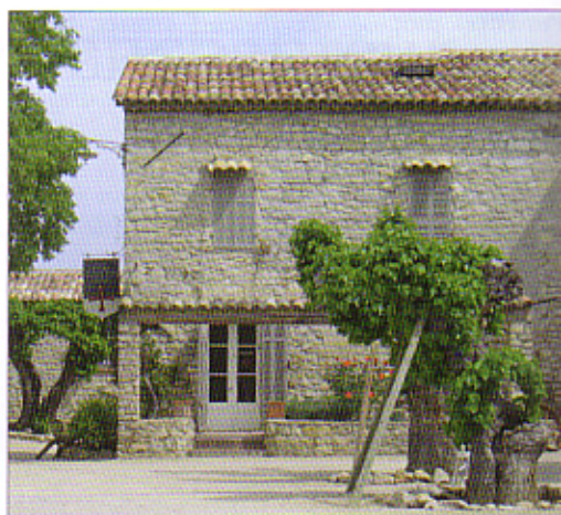
La Commanderie de Peyrassol - qui doit son nom aux Templiers - n'a connu que trois propriétaires depuis la dissolution de l'Ordre en 1311.

Ce domaine de 1 500 hectares, situé sur la commune d'Ollières, tout près de Saint-Maximin conjugue activité viticole, sylvicole, agro-pastorale, touristique et réceptive. Les cent hectares de vignes cultivées selon le label Terra Vitis, produisent essentiellement du vin rosé et de petits volumes de vin rouge. La forêt certifiée, composée d'espèces méditerranéennes, chênes verts et chênes blancs, est exploitée de manière rationnelle pour le bois de chauffage. Une partie est transfor-