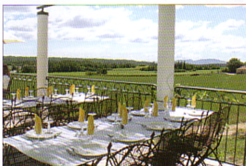
Le restaurant, à la cuisine traditionnelle et locale, offre une vue splendide sur le domaine.

mée sur place en plaquettes qui permettent de chauffer l'ensemble des installations du domaine. L'hiver, des bovins en provenance de l'Isère pâturent librement dans les sous bois où vivent également sangliers et chevreuils. Plus de 45 kilomètres de chemins parcourent cette forêt, un vrai paradis pour les randonneurs et amateurs de VTT. Pour vous héberger, pas de souci : 15 gîtes de catégorie 3 à 4 étoiles, complétés d'une auberge de 7 chambres à petit budget et d'un res-