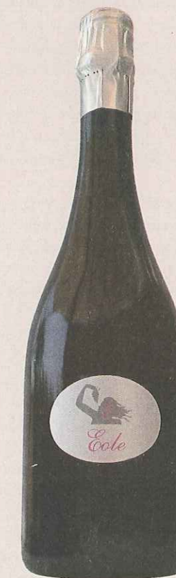
ÉOLE BRUT DU DOMAINE D'ÉOLE. Jolie réussite que ce vin tonique à la bulle fine.

Méthode traditionnelle Les Bulles Robe fuchsia léger, bulle fine. Nez très fraise, avec des notes florales. Bouche très fruitée, un peu simple, mais bien expressive. Prix : 8,50 €