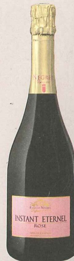
INSTANT ÉTERNEL DU MAS DE CADENET. Très abouti, ce rosé effervescent de la famille Négrel montre la voie à suivre.

Méthode traditionnelle Éole brut Vieux rose léger, bulle fine. Nez délicat de fruits rouges (groseille, framboise) et d'agrumes. Bouche aux notes pralinées, de fraise au four, de la tonicité et une mousse fine. Prix : 15 €